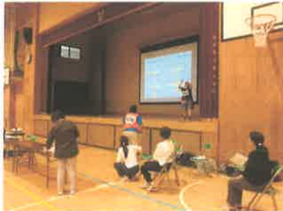
認知症サポーターによるご講演

総合的な学習の時間や学級活動などで、講師のお話を聞いたり体験活動したりする学習がありました。