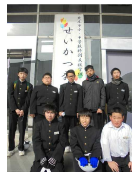
せいかつ発表会(わかば)(12.11)