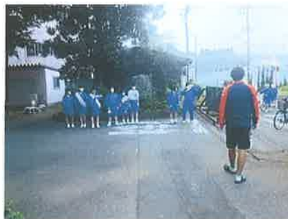
生徒会役員選挙の広報活動