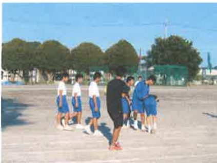
駅伝の放課後練習

各部の健闘がみられました。雨天の中で会場の水ぬきをするなど、進んで大会運営に協力していました。