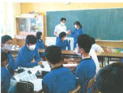
前期委員会の最終回の様子