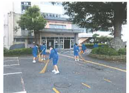
朝の美化活動継続中

※地域への「東中学校だより」は、生徒代表の「地域交流大使」がお届けいたします。 また、東中学校ホームページに掲載しています。