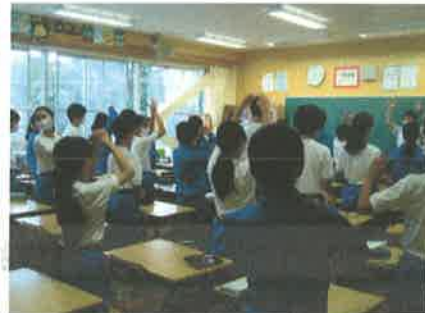
放送による生徒集会