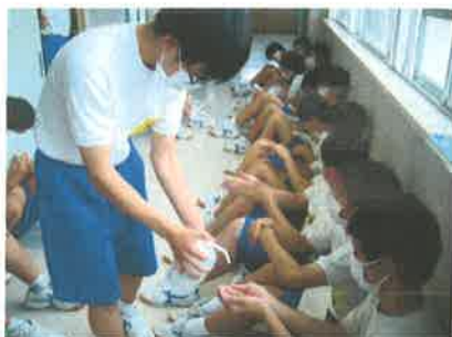
衛生管理の下での発育測定