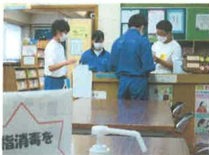
図書への貸し出し